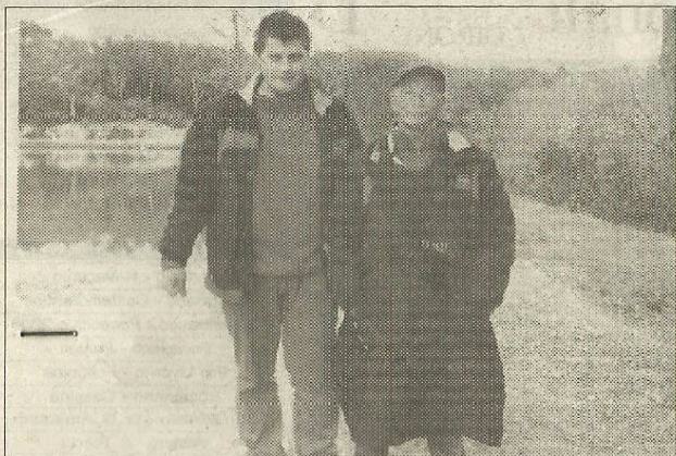
Bravi I primi della classifica generale